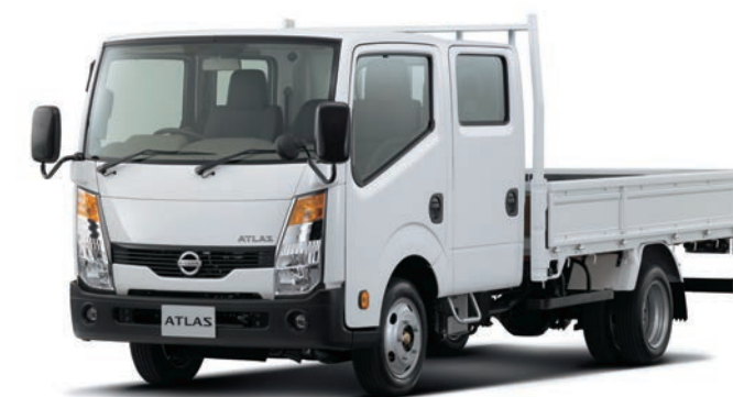
写真：車種番号 T13。ボディカラーはクリスタルホワイト(#531)