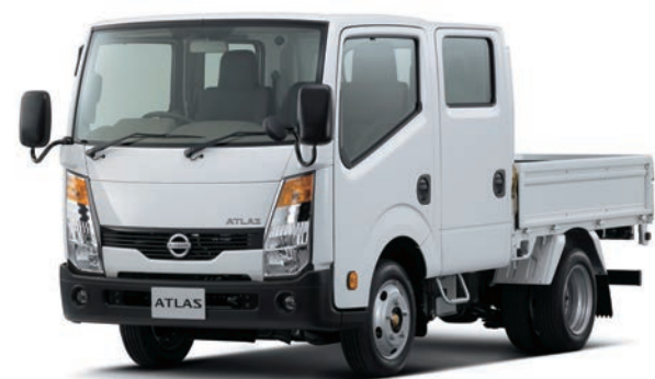
写真：車種番号 T09。ボディカラーはクリスタルホワイト(#531)