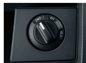
●ダイヤル式切換えスイッチ