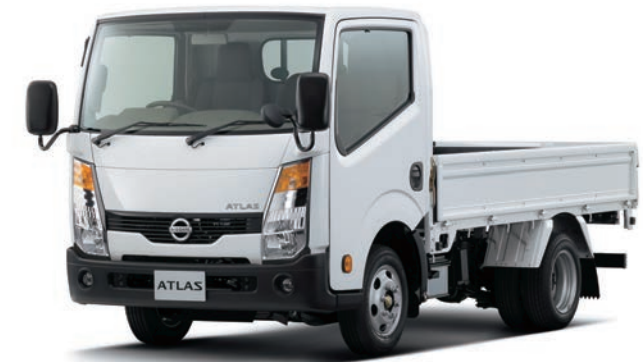
写真：車種番号 27。ボディカラーはクリスタルホワイト〈#531〉