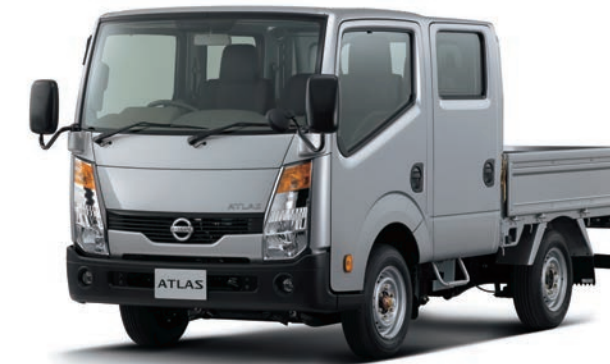
写真：車種番号 44。ボディカラーはダイヤモンドシルバー(M) (#KY0・特別塗装色)