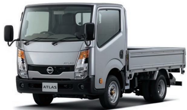
写真：車種番号 10。ボディカラーはダイヤモンドシルバー(M)〈#KY0・特別塗装色〉 ●工具箱はメーカーオプション