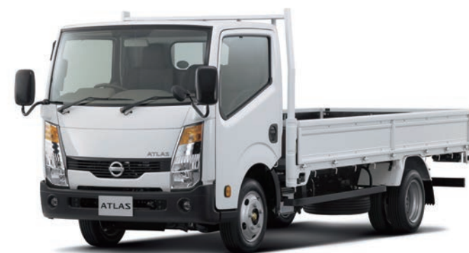
写真：車種番号 T05。ボディカラーはクリスタルホワイト(531)