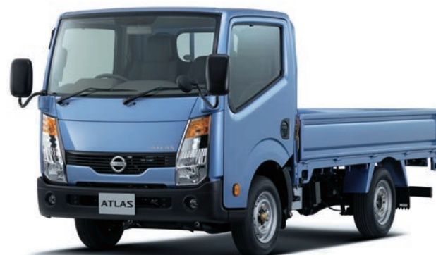
写真：車種番号 14。ボディカラーはライトブルー(M)〈#B61・特別塗装色〉