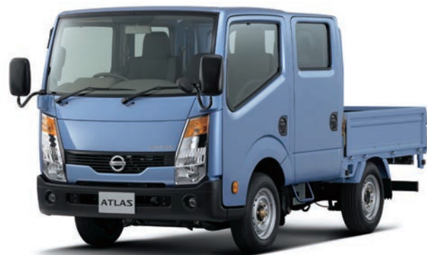
写真：車種番号 37。ボディカラーはライトブルー(M) (#B61・特別塗装色)