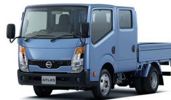
写真：車種番号 T11。ボディカラーはライトブルー(M)(#B61・特別塗装色) ●塩ビシートはメーカーオプション