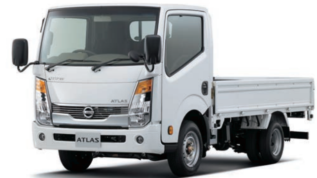
写真：車種番号 30 カスタム仕様。ボディカラーはクリスタルホワイト〈#531〉