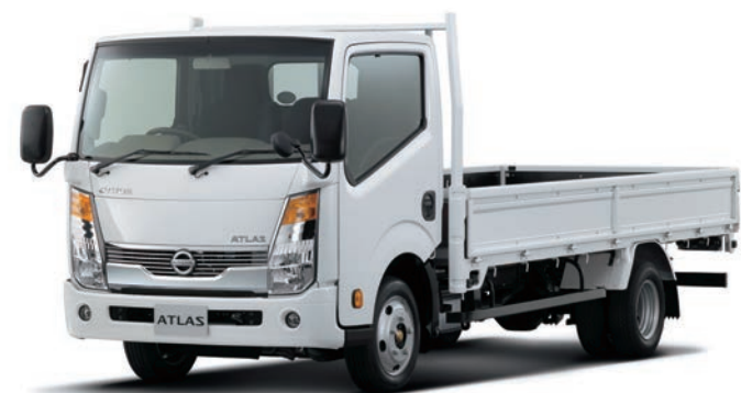
写真：車種番号 T07 カスタム仕様。ボディカラーはクリスタルホワイト(#531)