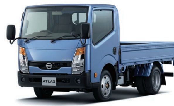
写真：車種番号 T01。ボディカラーはライトブルー(M)〈#B61・特別塗装色〉