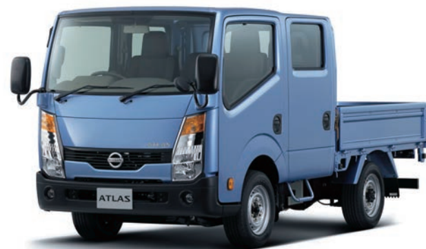
写真：車種番号 71。ボディカラーはライトブルー(M)〈#B61・特別塗装色〉