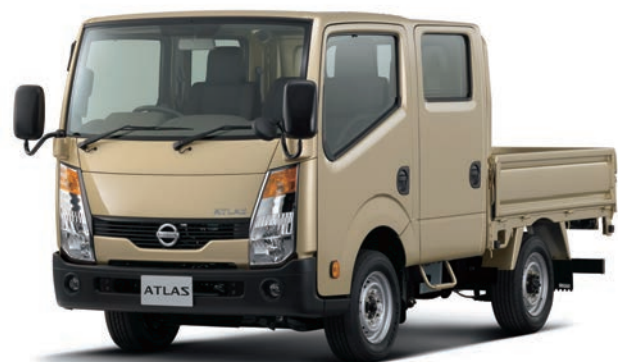
写真：車種番号 69。ボディカラーはライトゴールド(M)〈#E61・特別塗装色〉