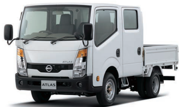
写真：車種番号 40。ボディカラーはクリスタルホワイト(#531)